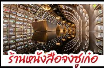
ร้านหนังสือจชชู่เก๋อ

ภูเขาสิ่ดรุณี - อุทยานปี้เฉิงโกว - รูปปั้นหมี่แพนด้า นอนเซลฟี ร้านหนังสือจชชู่เก๋อ - วัดต้าฉือ - ถนนโบราณชอยกว้างชอยแคบ เมบูพิศช สุกี้ที่มาล่าเสฉวน