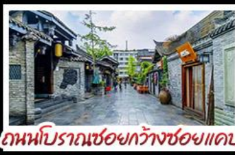
ถนนโบราณชอยกว้างชอยแคบ