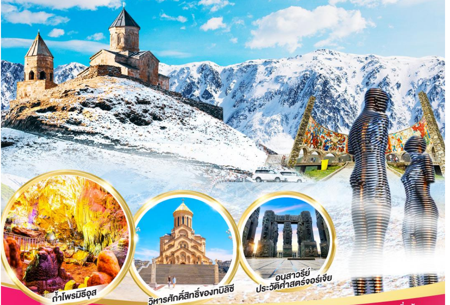
ถ้ำไฟมัลติคัลเลอร์