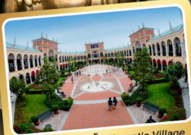
ช้อปปิ้ง Florentia Village