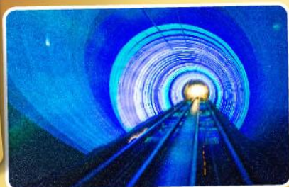
อุโมงค์เลเซอร์