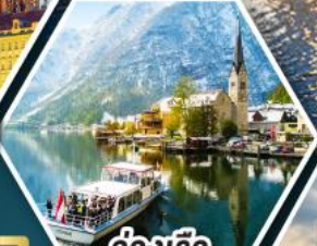
ล่องเรือ ทะเลสาบอัลสติก