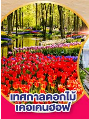
เทศกาลดอกไม้ เคอเคนฮอฟ