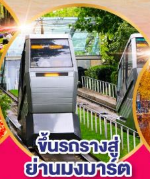
ชั้นรางสู่ ย่านมงมาร์ต