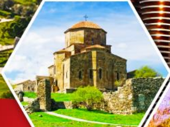
วิหารจวารี