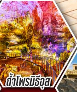
ถ้ำไฟรมีร์อูส