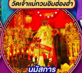
นมัสการ องค์เจ้าแม่กวนอิม ที่มีอายุกว่า 600 ปี