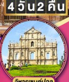
วิหารเซนต์ปอล