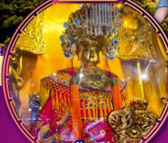
หอพระด้านสูงภาพ และการเดินทางปลอดภัย