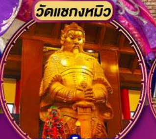
หอพระโชคลาภ การเงิน และธุรกิจ