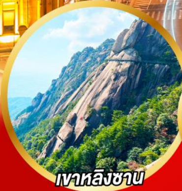
เวาหลิงซาน