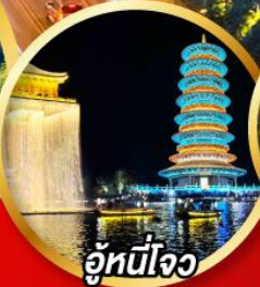
อู่หนี่โจว