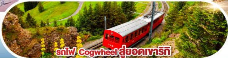
รถไฟ Cogwheel สู้ออดเวาริก

เดินทาง 01-10 เม.ย. 68 / 30 เม.ย. - 09 พ.ค. 68 03-12, 04-13, 05-14 พ.ค. 68