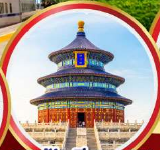
หอฟ้าเทียนถาน กำแพงเมืองจีน