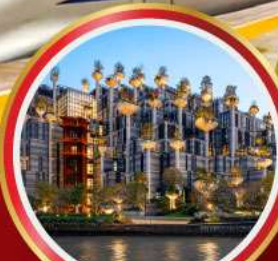
อาคารพินตันไม้