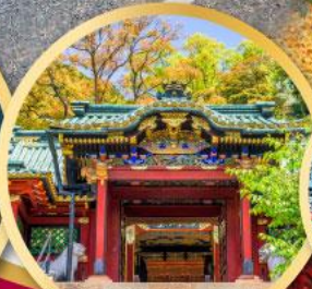
ศาลเจ้าโทโชคุ