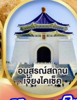
อนุสรณ์สถาน เจียงไคเช็ค