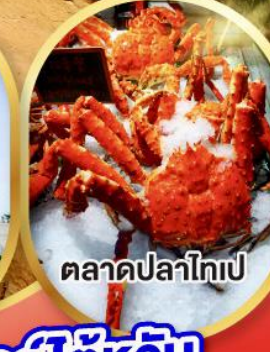
ตลาดปลาไทเป