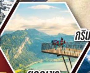
ยอดเขา ฮาร์เดอร์คลูม