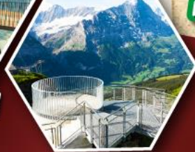
ยอดเขา กรินเดลวาลด์ เฟียสตี