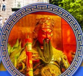
วัดกวนโถ