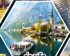
ล่องเรือ ทะเลสาบอัลสติก