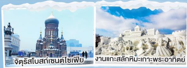
จัตุรัสโบสถ์เซนต์โซเฟีย