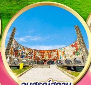
อนุสรณ์สถาน รัสเซีย-จอร์เจีย