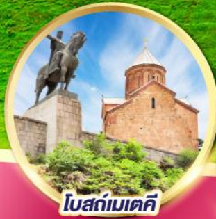
โบสถ์เมเตคี