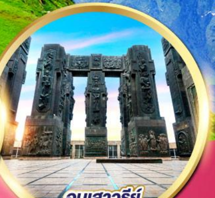
อนุสาวรีย์ ประวัติศาสตร์จอร์เจีย