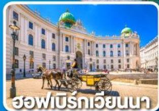
ฮอเฟิเบร์กเวียนนา