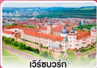
เว็ร์ชบวร์ค