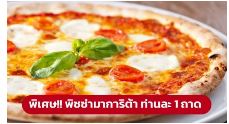
พิเศษ!! พิซซ่ามาการิตต้า ท่านละ 1 ถาด

นำท่านเดินทางสู่ เมืองเวนิสเมสเตร (Venice Mestre) (ระยะทาง 264 ก.ม. / 4 ชม.) เป็นย่านเมืองเก่าแก่ที่มีความสวยงามและแสดงให้เห็นถึงความ เป็นอิตาเลียนขนานแท้