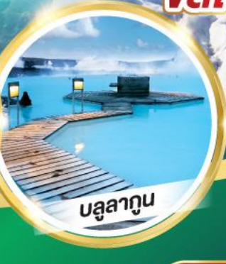
บลูลากูน