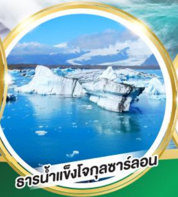
ธารน้ำแข็งโจกุลชาร์ลอน