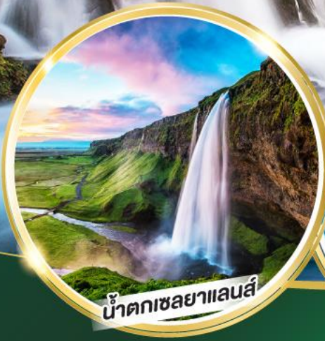
น้ำตกเซลยาแลนส์