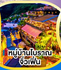
หมู่บ้านโบราณ จิวเฟิ่น