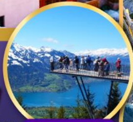
ยอดเขา ฮาร์เตอร์คูลม