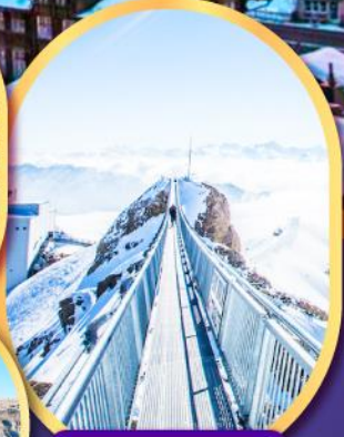
ยอดเขา กลาเซียร์ 3000