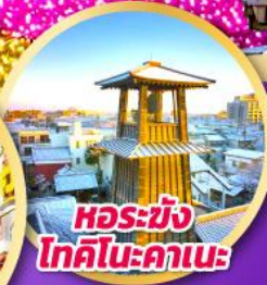
หอรุซัง โทคิโนะคานะ