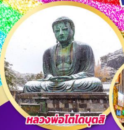
หลวงพ่อโตโดบุตสึ