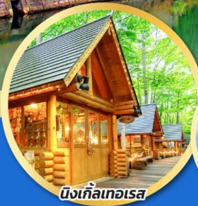
นิงเกิลเทอเรส