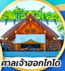
ศาลเจ้าออกโทโด