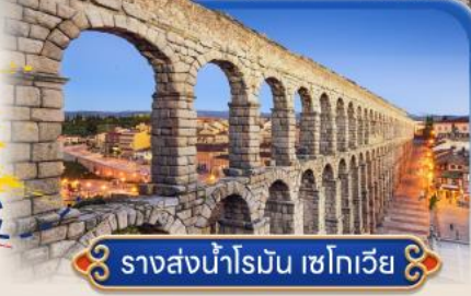
รางส่งน้ำโรมัน เซโกเวีย

สายการบินสัญชาติสเปน ✕บินตรง Full Service