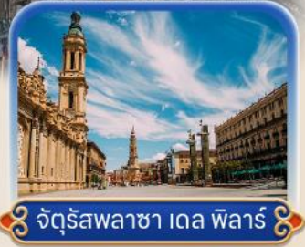
จัตุรัสพลาซา เดล พ็ลาร์