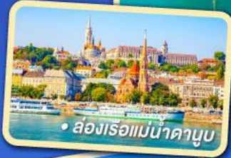
ล่องเรือแม่น้ำดานูบ