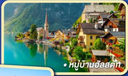
หมู่บ้านฮัลสตัทท์