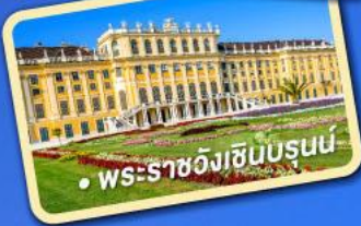
พระราชวังเชินบรุนน์