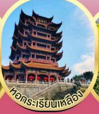
หอกระเรียนหลืออง