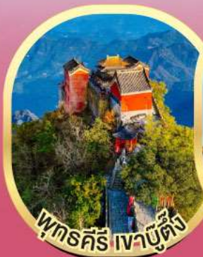
พุทธคีรี เจาบูต้ง