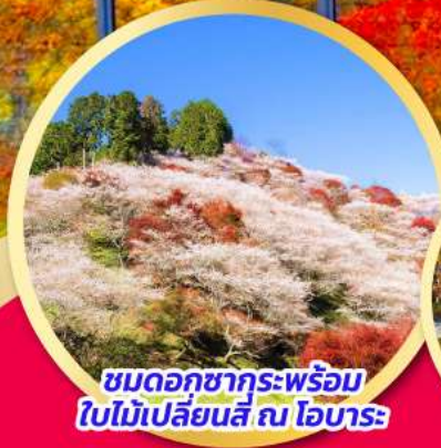
ชมดอกซากุระพร้อม ใบไม้เปลี่ยนสี ณ โอบาระ