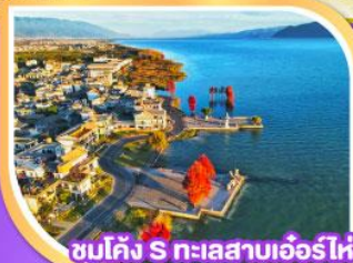
ซัมคิง S ทะเลสาบเอ๋อร์โหล