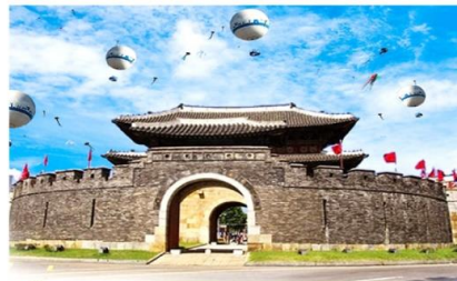
ชั้นบอลลูน