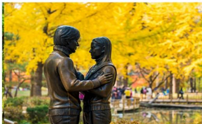
เกาะนามิ