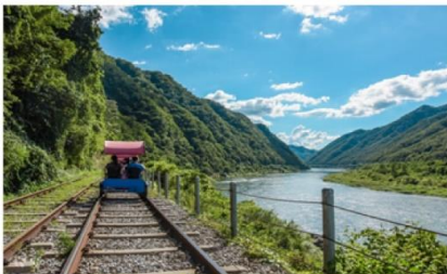
( Rail Bike )