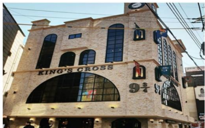
คาเฟ่แควรี่พ็อตเตอร์