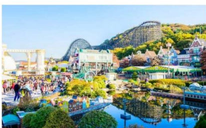
สวนสนุกเอเวอร์แลนด์