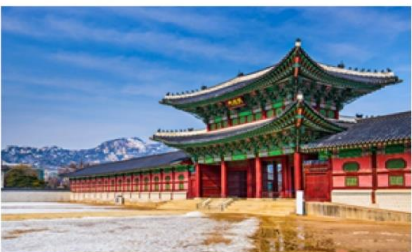
พระราชวังชางด็อกกุง