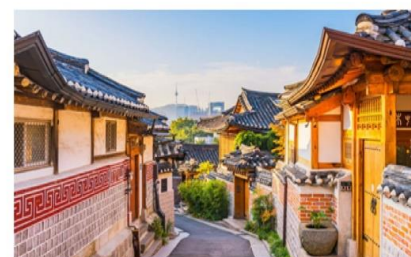
หมู่บ้านโบราณฮุกซอน