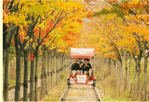
นำทุกท่านสัมผัสธรรมชาติและเปิดประสบการณ์

เที่ยง! บริการอาหารกลางวัน เมนูทักคาบิหรือไก่บาร์บีคิว ซอสเกาหลี (อาหารเลี้ยงซื้อโดยการนำไก่บาร์บีคิว มันหวาน กะหล่ำปลี ต้นกระเทียม ซอส และข้าว มาผัดรวมกันบนกระทะ แบนสีดำคลุกเคล้าทุกอย่างให้เข้าที่ รับประทานคู่กับผักกาดเกาหลี และเครื่องเคียงต่างๆ)