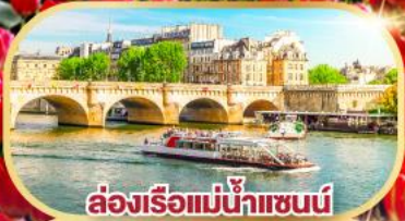
ล่องเรือแม่น้ำแซนน์