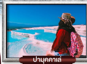
ป่ามุกคาล่า