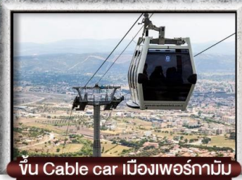
ขึ้น Cable car เมืองเพอร์กามัน