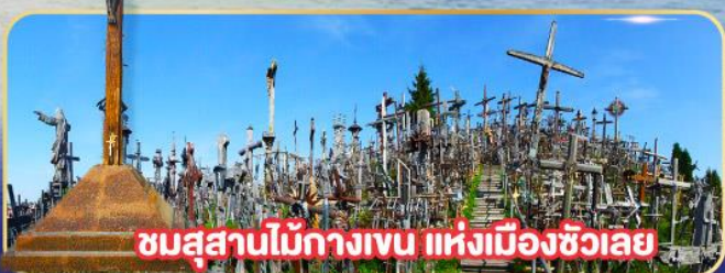
ชมสุสานไม้กางเขน แห่งเมืองซิวเลย์