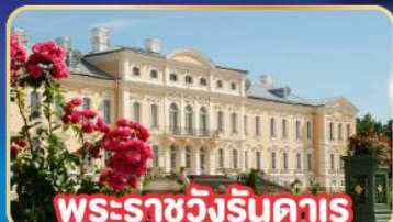
พระราชวังรินดาร์