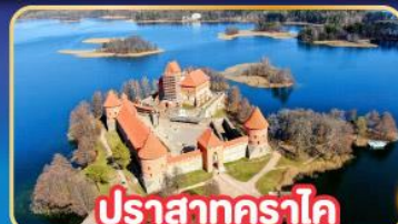
ปราสาทคราโค

พิเศษ! เที่ยวเก็บครบทุกประเทศยุโรปเหนือ ลิทัวเนีย , ลัตเวีย , เอสโตเนีย , ฟินแลนด์