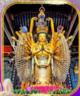
วัดหลงหวู่

(อิสระ-ช้อปปิ้ง หรือ สุกสุดมันส์ที่ Disney Land)