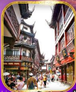
ตลาด 100 ปี เจิงหวังเหมี่ยว