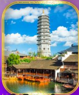
เมืองโบราณฟู่หยวน