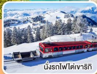
นั่งรถไฟโตเงาริก