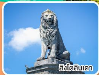
สิงโตลิบเดา