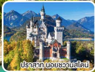
ปราสาท นอยชวานสไตน์