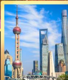
เซี่ยงไฮ้