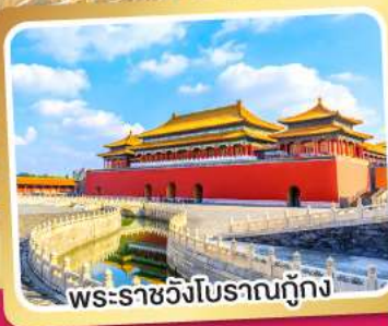
พระราชวังโบราณกั๋ง