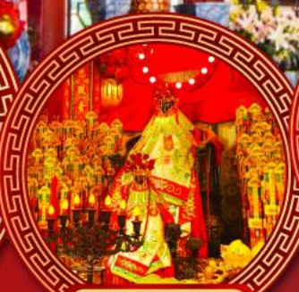
วัดเจ้าแม่กวนอิม ฮ่องฮำ