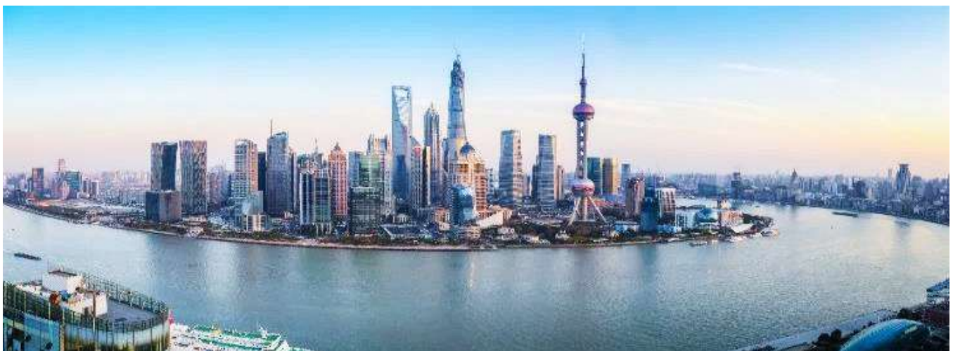
GO1PEK-CA010 มนสที่สุด!! บกก เชียงไฮ้ Universal Studio Beijing + Shanghai Disneyland 6 วัน 4 คน โดยสายการบิน Air China (CA)

นำท่านสู่บริเวณ หาดไว่ทาน ตั้งอยู่บนฝั่งตะวันตกของแม่น้ำหวงผู้มีความยาวจากเหนือจรดใต้ถึง4 กิโลเมตร ถือเป็นสัญลักษณ์ที่โดดเด่นของนครเซี่ยงไฮ้อีกทั้งถือเป็นศูนย์กลางทางด้านการเงินการ ธนาคารที่สำคัญแห่งหนึ่งของเซี่ยงไฮ้ตลอดแนวยาวของหาดไว่ทานเป็นแหล่งรวมศิลปะ สถาปัตยกรรมที่หลากหลาย เช่น สถาปัตยกรรมแบบโรมันโกธิคบารอครวมทั้งการผสมผสาน ระหว่างสถาปัตยกรรมตะวันออก-ตะวันตกเป็นที่ตั้งของหน่วยงานภาครัฐเช่น กรมศุลกากร โรงแรม และสำนักงานใหญ่ของธนาคารต่างชาติเป็นต้น