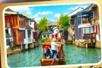
ล่องเรือเมืองโบราณซูเจียเจียว