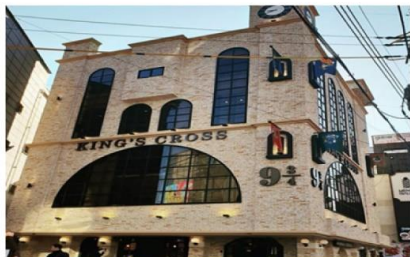
คาเฟ่แควรี่พ็อตเตอร์