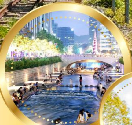
คลองชองเกซอน