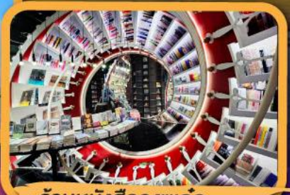
• ร้านหนังสือจวงซูเก้อ