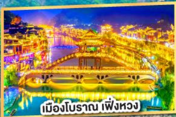
เมืองโบราณ เพิ่งหวง