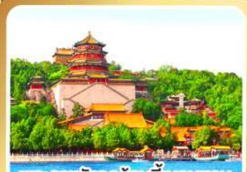
พระราชวังฤดูร้อนอ้อหุหยวน