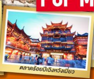
ตลาดร้อยปีจังหวัดเมือง