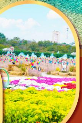
สวนสวรรค์แห่งดอกไม้ Manhua Manor