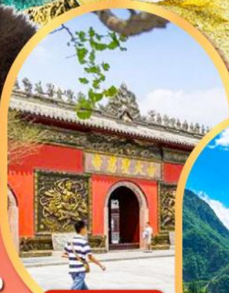
วัดต้าฉี