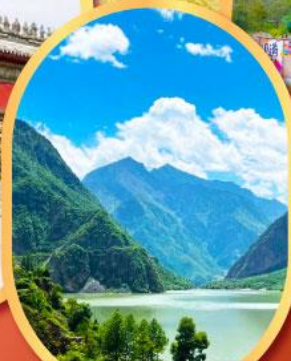
ทะเลสาปเต๋ยซี