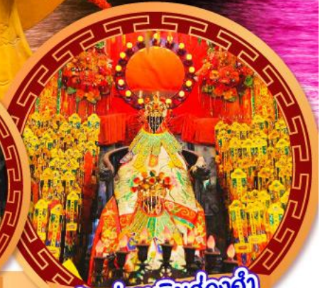
เจ้าแม่กวนอิมฮ่องอ่า

นมัสการเจ้าแม่กวนอิมฮ่องอ่า หมูนกั๊กหันรับโชคลากเงินทองที่วัดแซกงหวัด ขอพรความรักกับผู้เต่าจีนตรา วัดหวังต้าเซียน