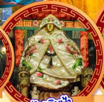
วัดเลิ๊งฟ้า