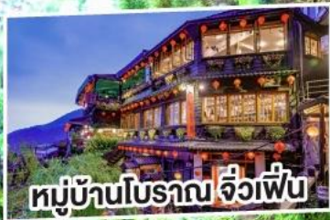
หมู่บ้านโบราณ จ๊วเพื่อน