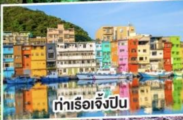
ท่าเรือเจ๋งป็น