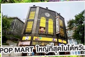
POP MART ใหญ่ที่สุดในไต้หวัน