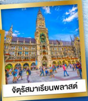
จัตุรัสมาเรียนพลาสต์