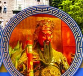
วัดกวนโถ