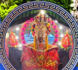
วัดเจ้าแม่ทับทิม