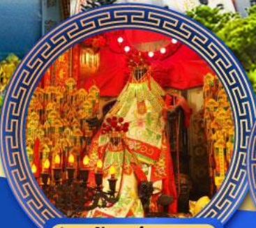
วัดเจ้าแม่กวนอิม ฮ่องกง